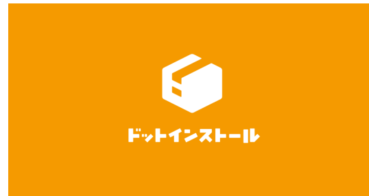
ドットインストール